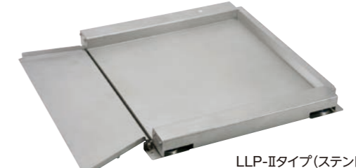
LLP-IIタイプ (ステンレス)